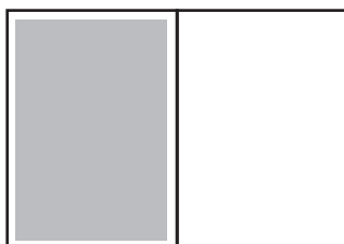
Helsida: 250 x 372 mm