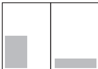
Stående kvartssida: 122 x 184 mm Liggande kvartssida: 250 x 90 mm